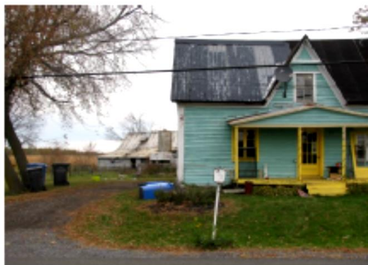
Photo de Laurie Lemoine, 12 ans – Saint-Robert Lauréate volet régional

Texte : J'ai choisi l'église Saint-Michel de Yamaska parce que j'ai été séduite par son architecture ancestrale. Celle-ci témoigne de l'histoire de cette municipalité rurale. Je suis impressionnée par l'envergure de cette construction bâtie sur une période de 1839 à 1845. En arrière-plan, on remarque une charmante maison historique qui sert de lieu communautaire pour l'AFEAS des femmes de la région.